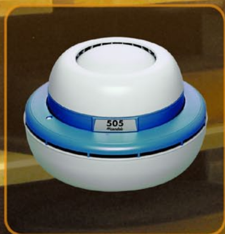
Condair 505 – l'universel