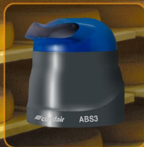
Condair ABS3: un appareil puissant et polyvalent

Horizontal ou vertical ? Les diffuseurs de cet atomiseur compact dispersent le fin brouillard d'aérosol sans gouttes dans la direction choisie. L'appareil se nettoie en un tour de main. C'est vous qui décidez si vous souhaitez raccorder votre Condair 505 au réseau d'eau ou remplir le réservoir d'eau manuellement.