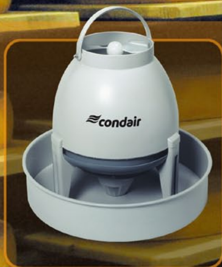
Condair 3001 – le plus sûr