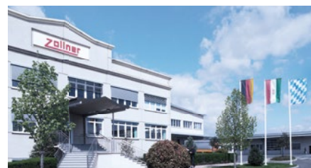
Zollner Elektronik Gyártó és Szolgáltató Kft. (Vác)

2015 óta az „Automotive” termelési területen DRAABE levegő párasító rendszert használnak. 100 darab direkt helyiség párasító védi az érzékeny nyomtatott áramkör beültetést az ellenőrizetlen elektrosztatikus feltöltődésektől és a termelési zavaroktól.