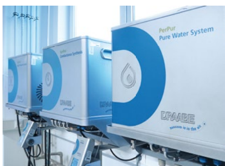
A DRAABE vízelőkészítés kis konténerai 6 havonta cseréje kerülnek

Cser Géza. „A kis konténerok automatikus, félfévente történő cseréje mindig működőképes és higiénikus berendezést biztosít.”