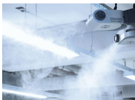
A TurboFogNeo levegő párasítók eleget tesznek a tiszta helyiségekre vonatkozó követelményeknek