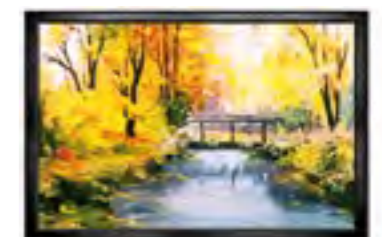
Empfohlene Luftfeuchte für Gemälde oder Galerien: 50% r. F.