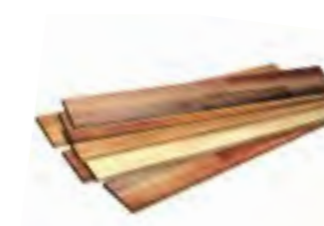
Empfohlene Luftfeuchte für Holzmöbel und Parkett: 55 - 60% r. F.