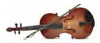
Empfohlene Luftfeuchte für Holzinstrumente: 40 - 65% r. F.