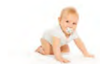
Empfohlene Luftfeuchte für den Menschen: 40 - 60% r. F.

Abhilfe schafft eine optimale Luftbefeuchtung durch Komfort-Luftbefeuchter von Condair.